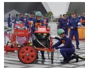
消防団操法大会に今年も選手で出場