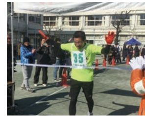
恒例の上野毛新春マラソン