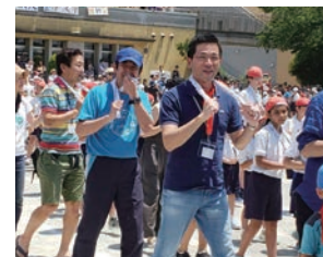
小学校の運動会にて「中町音頭」を