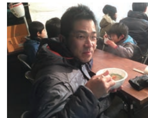
歳末夜警後にどん汁を一杯