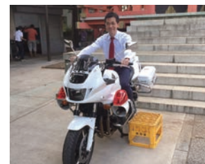
野毛子ども祭りにて白バイと