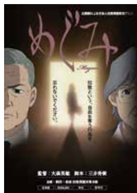
若年層への理解促進を図るため作成されたアニメ「めぐみ」